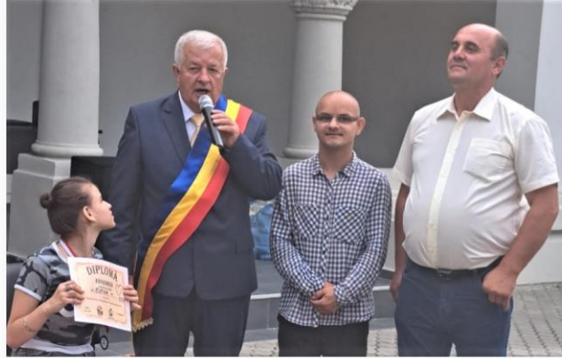
MTB GOVORA 2022